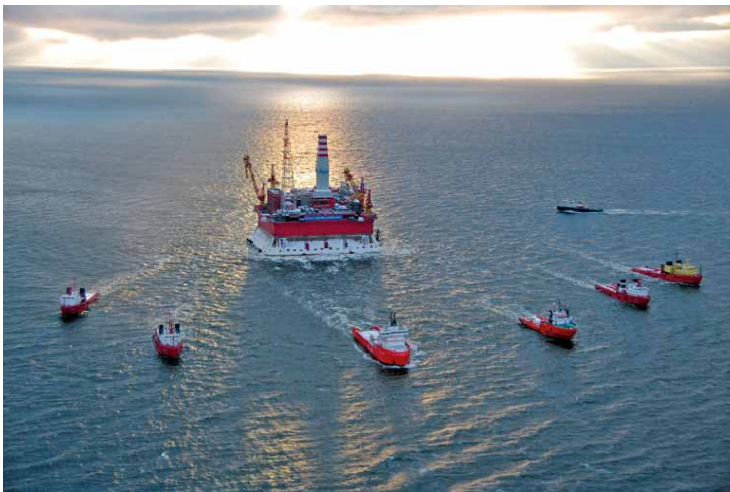
Транспортировка морской ледостойкой стационарной платформы «Приразломная»

Идеология совместных действий определяется Соглашением о стратегическом партнерстве в сфере экономического и социального развития Северо-Запада Российской Федерации на период 2012-2020 годов, которое объединяет интересы всех участников процесса реализации Стратегии.