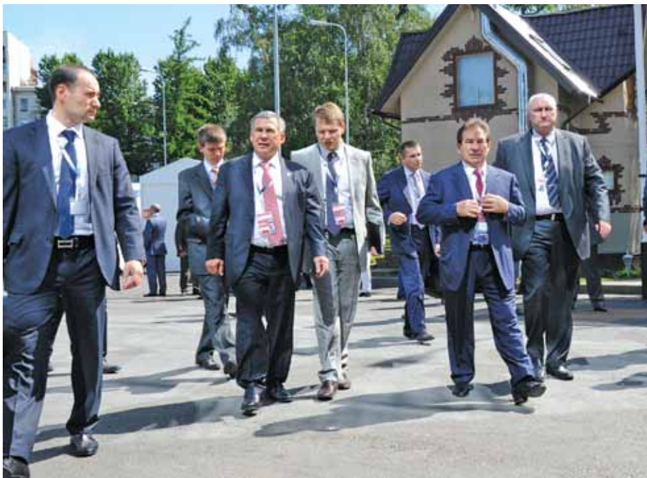
Делегация Республики Татарстан на Петербургском международном экономическом форуме – 2012

Важным событием последних лет стал Петербургский Партнериат «Санкт-Петербург – регионы России и зарубежья. Межрегиональное и международное сотрудничество малого и среднего бизнеса». В Партнериате-2012 приняли активное участие Агентство Инвести-