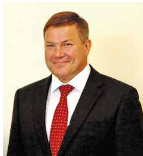
О. А. Кувшинников

– Мы отмечаем положительную динамику торгово-экономических связей наших регионов. По данным государственной статистики в 2011 году поставлено продукции из Вологодской области в Санкт-Петербург на сумму более 19 миллиардов рублей (в 2010 году – на 12 миллиардов). Из Санкт-Петербурга в Вологодскую область поставлено продукции почти