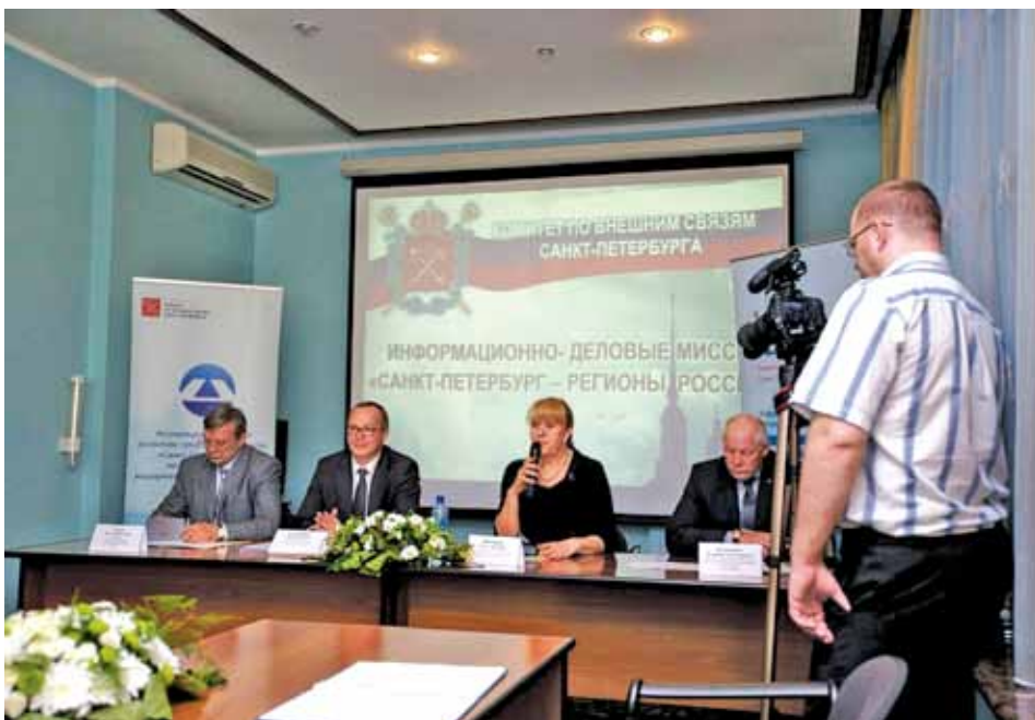
Информационно-деловая миссия Санкт-Петербурга в Красноярске

Еще одной новинкой года стал проект «Открой свою страну» – обмен с регионами России наружной рекламой, приглашающей россиян посетить Санкт-Петербург, а петербуржцев – российские регионы. Первыми участниками проекта стали Казань и Москва.