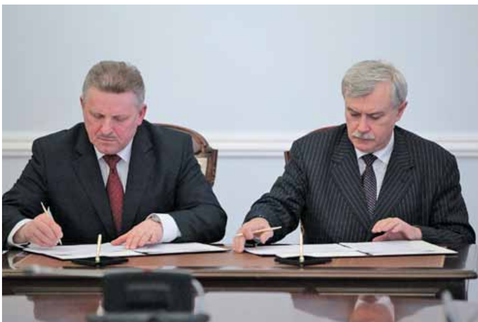
Подписание соглашения о сотрудничестве с Хабаровским краем

Для компаний из регионов это предоставляет реальный шанс интегрироваться в экономику Санкт-Петербурга. Мы заинтере-