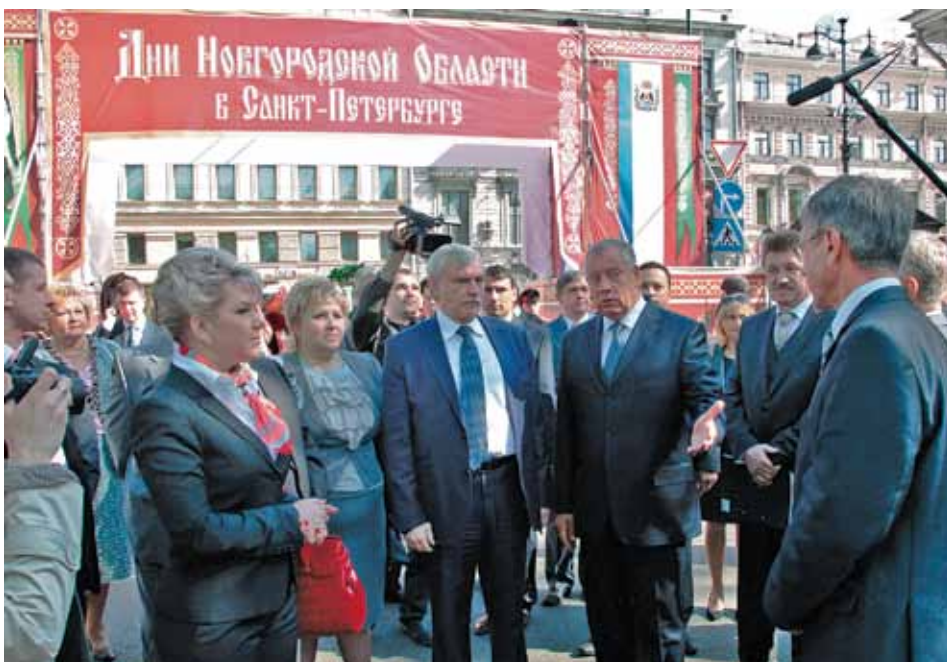
Дни Новгородской области в Санкт-Петербурге

Традиционно богат событиями оказался и букет культурных мероприятий 2012 года. В город на Неве с гастрольями приезжали региональные театры и музыкальные коллективы, петербургские артисты побывали в десятках городов России. Санкт-Петербург, как культурная столица России, уделяет большое внимание культурному обмену с регионами РФ. Сохранять, приумножать и нести культуру в самые дальние уголки России – это часть великой миссии нашего города, которая находит свое отражение и в проведении Дней культуры Санкт-Петербурга, и в росте туризма, в молодежном и ветеранском обмене.